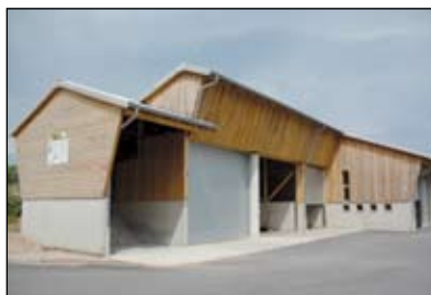
Hejtigilo kaj stokejo de ligno-pecoj