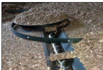
Ligno-pecetoj en la stokujo