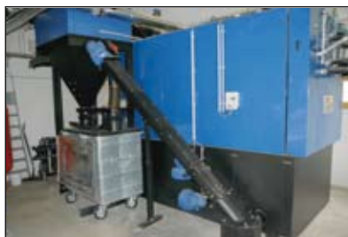
Hejtigilo kun aŭtomata elcendrado kaj cendrujo