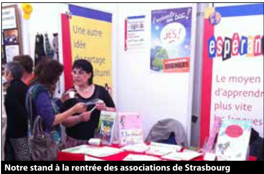
Notre stand à la rentrée des associations de Strasbourg

Il facilite aussi l'utilisation de l'espéranto à ses membres par les différents services et programmes qu'il leur propose.